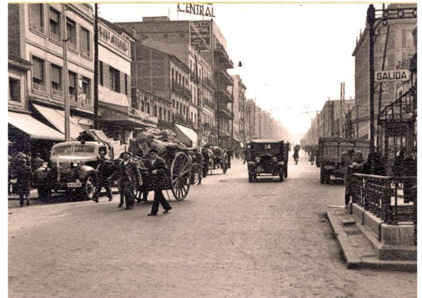
Calle José Antonio (Gran Vía), 1950.