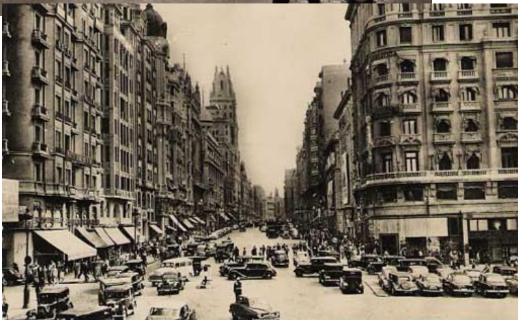
GRAN VÍA DE MADRID EN LOS AÑOS 50