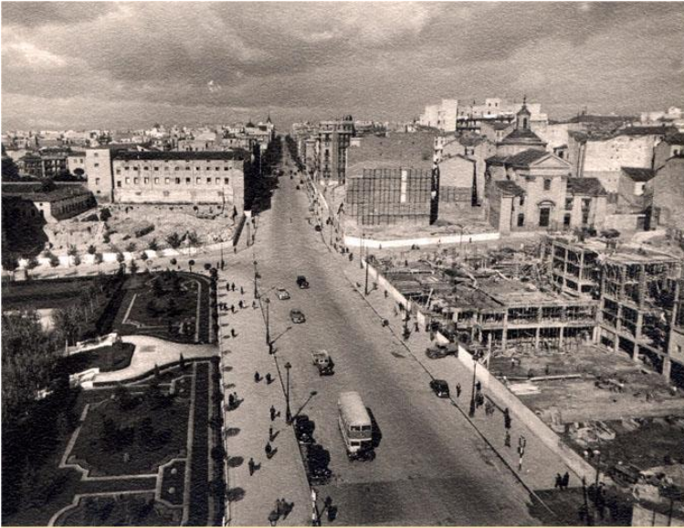
Calle Princesa, Argüelles, 1949.