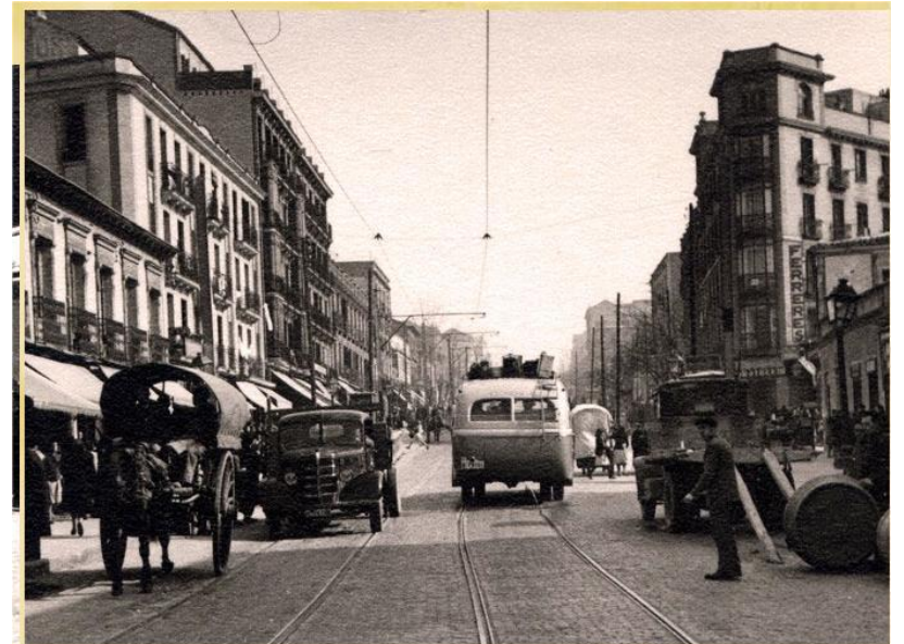
Estrecho, calle Bravo Murillo, 1950.